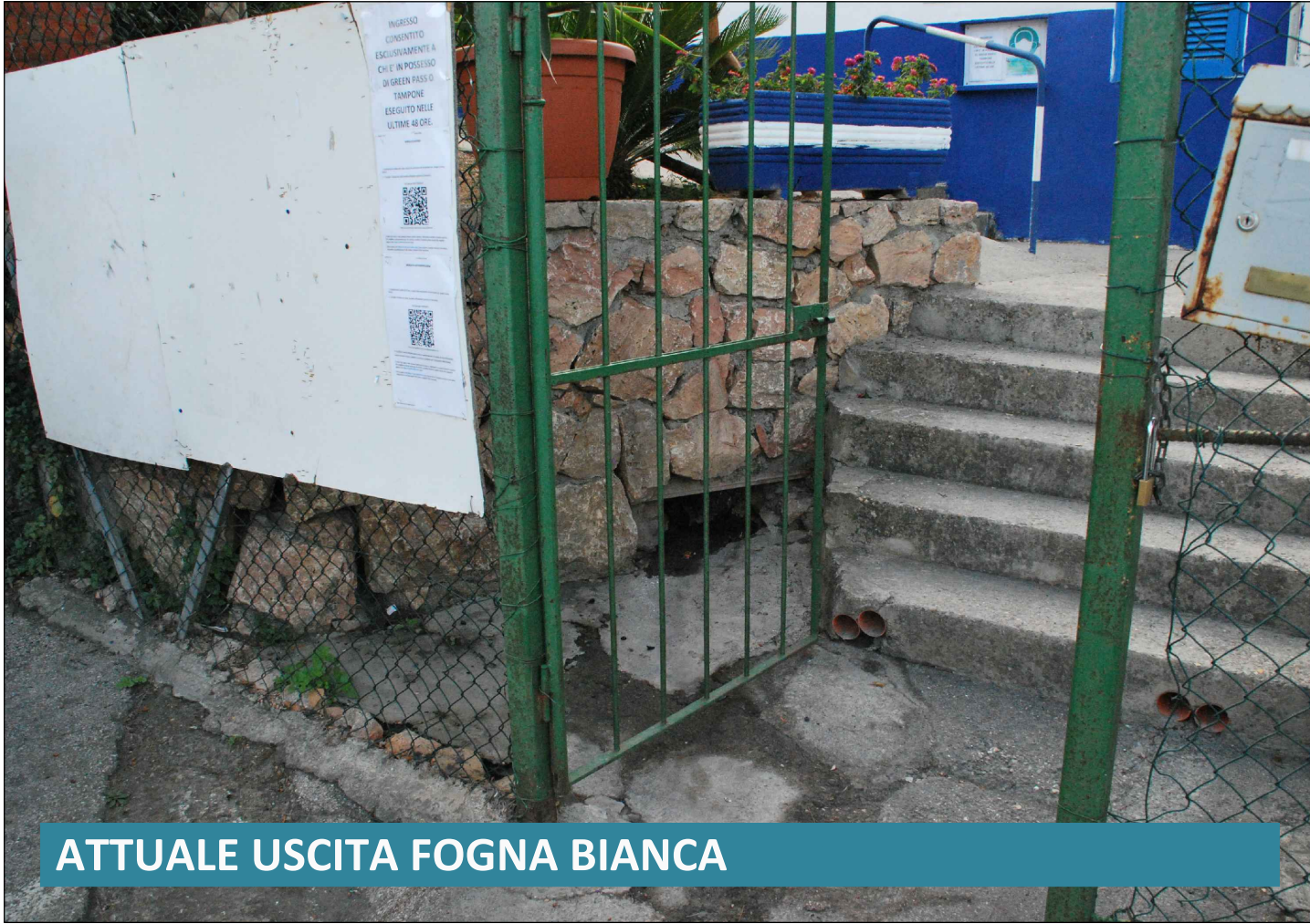
ATTUALE USCITA FOGNA BIANCA