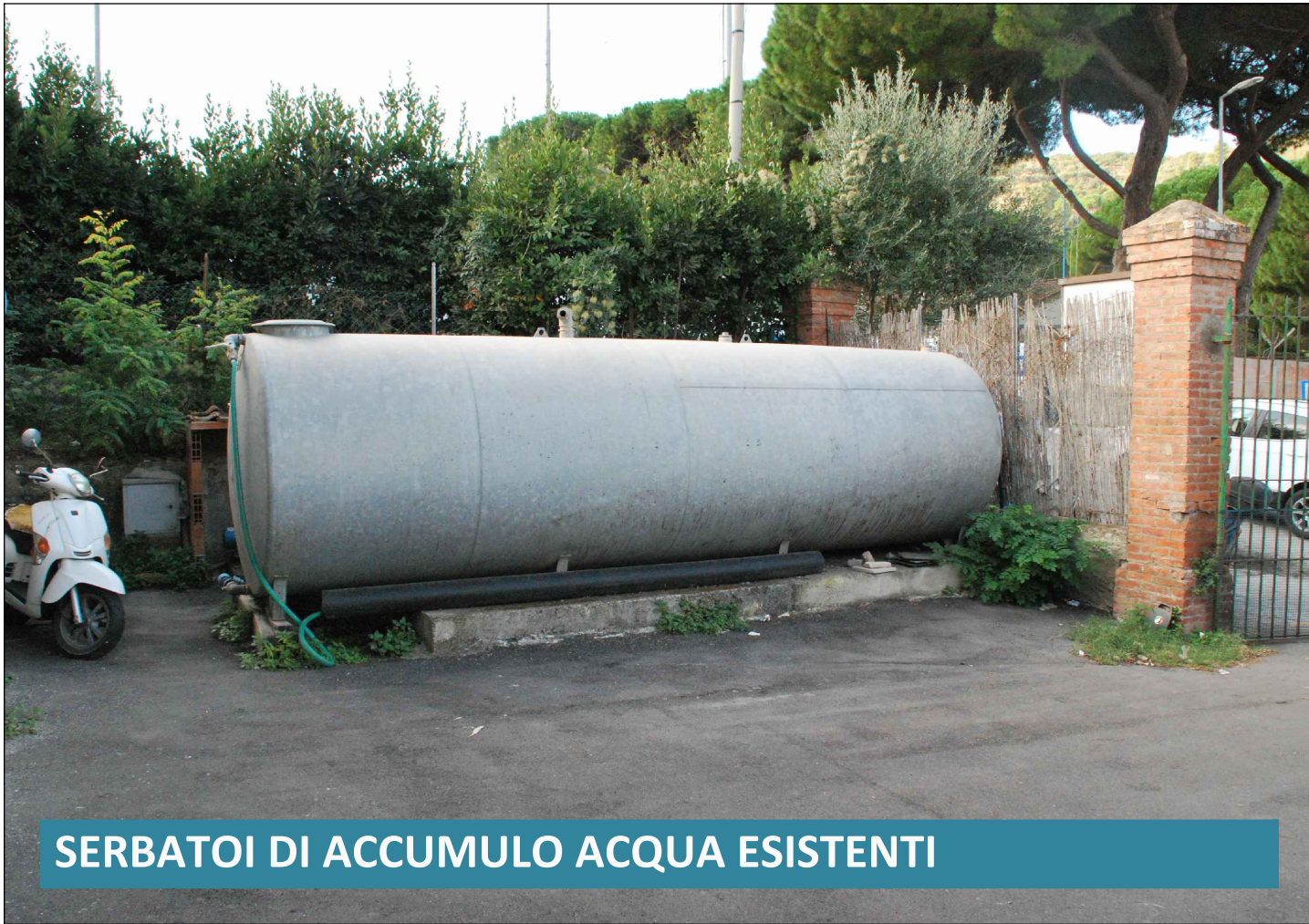
SERBATOI DI ACCUMULO ACQUA ESISTENTI