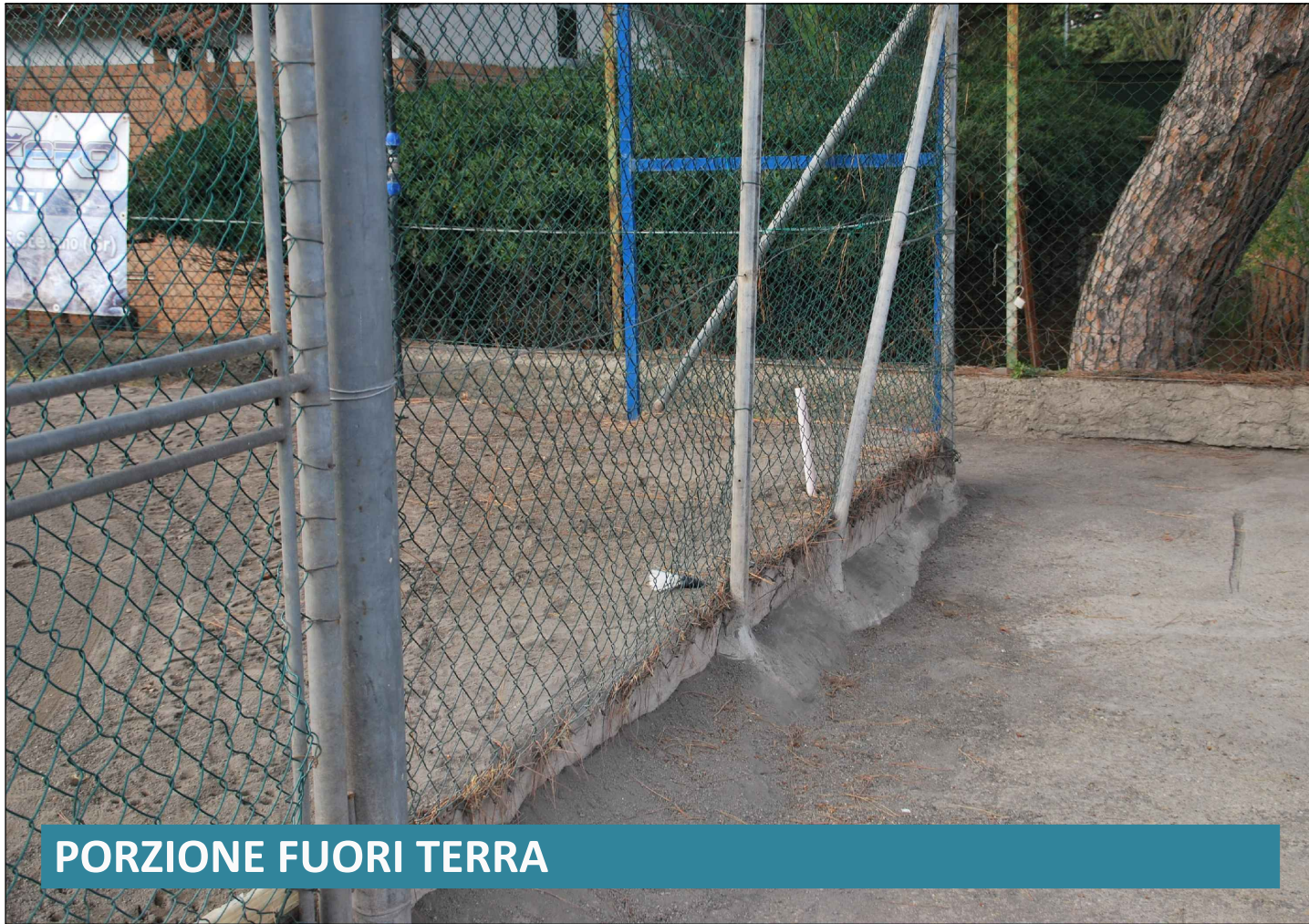
PORZIONE FUORI TERRA