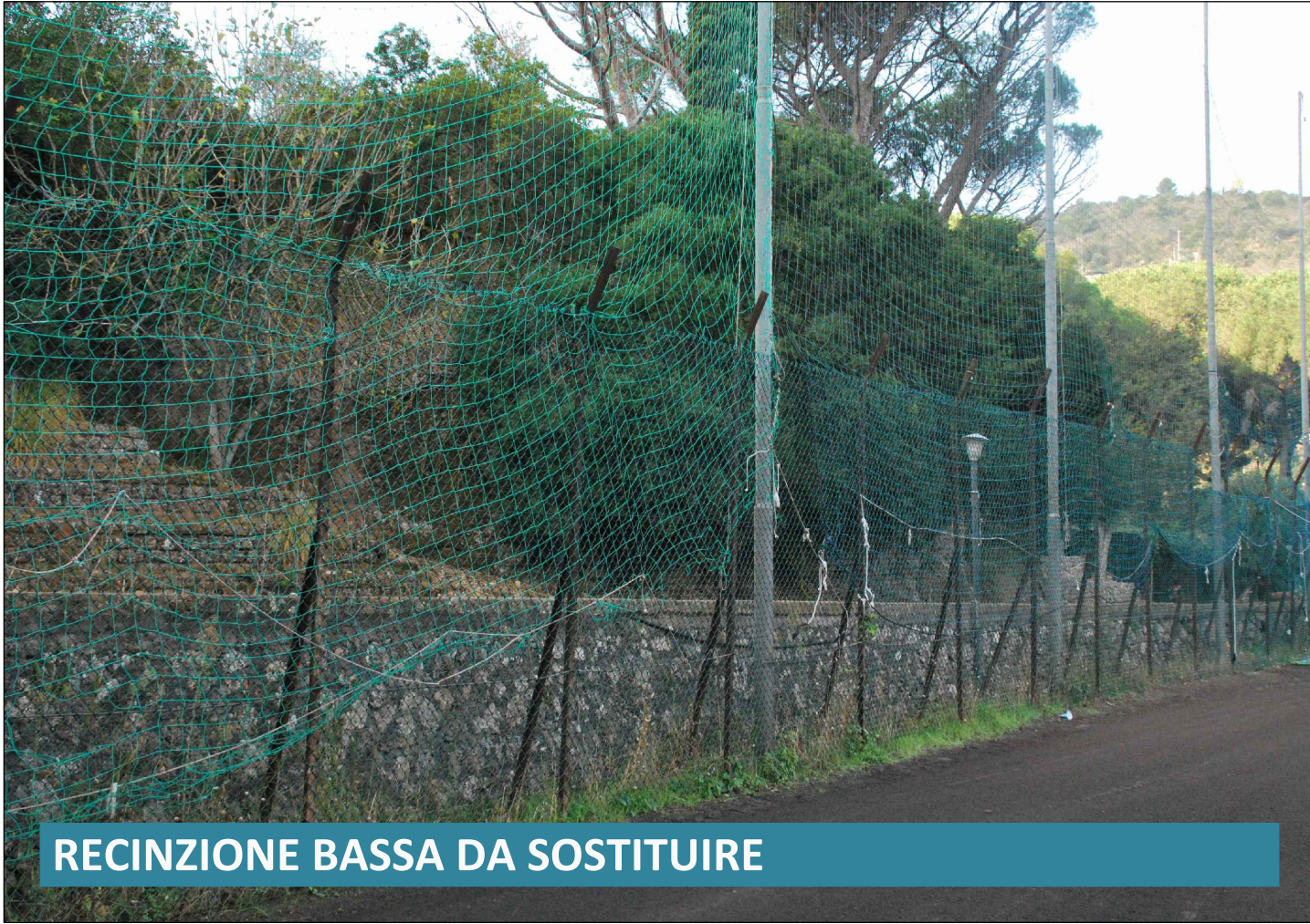
RECINZIONE BASSA DA SOSTITUIRE