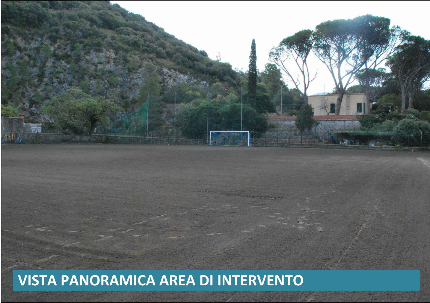
VISTA PANORAMICA AREA DI INTERVENTO