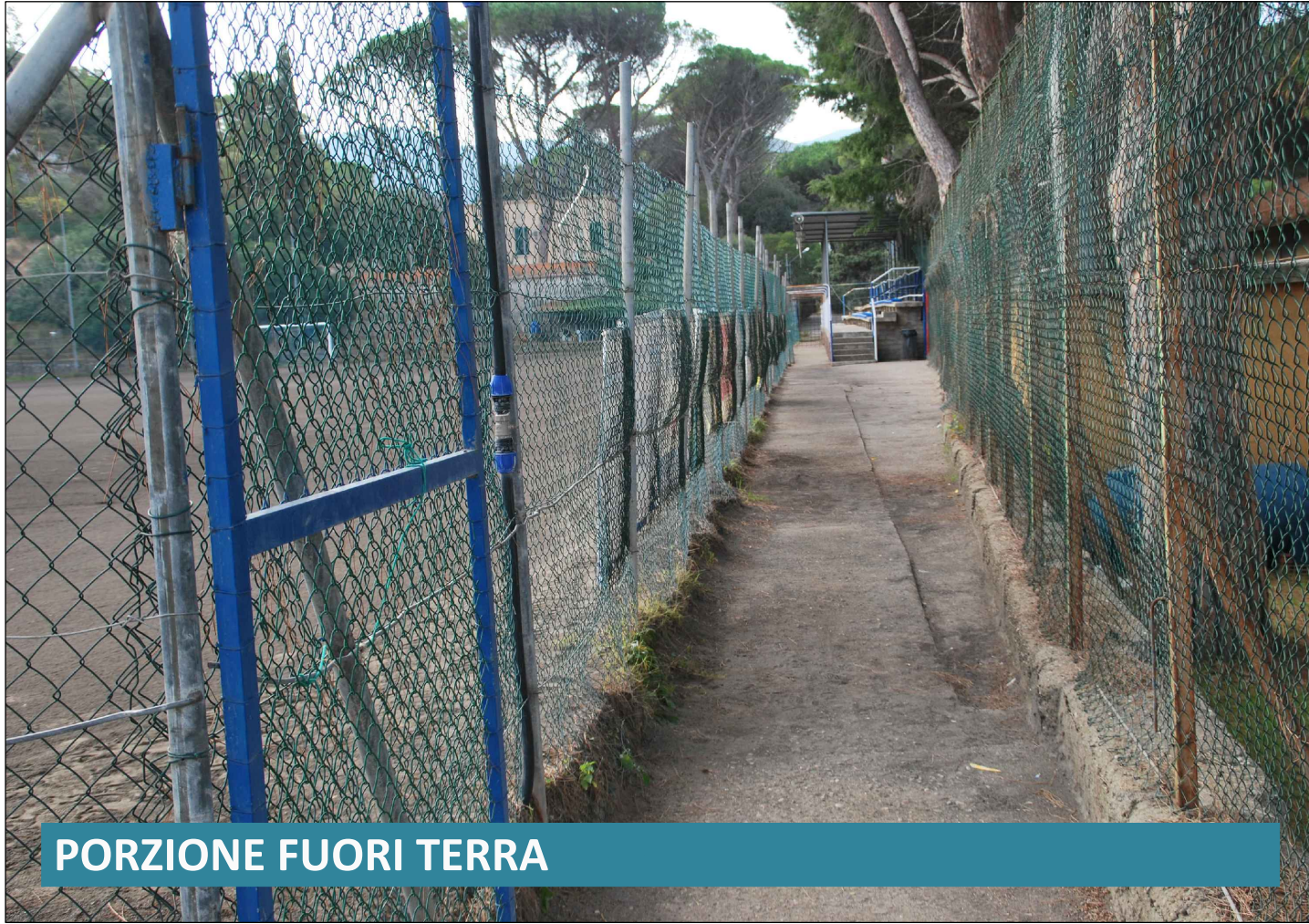
PORZIONE FUORI TERRA