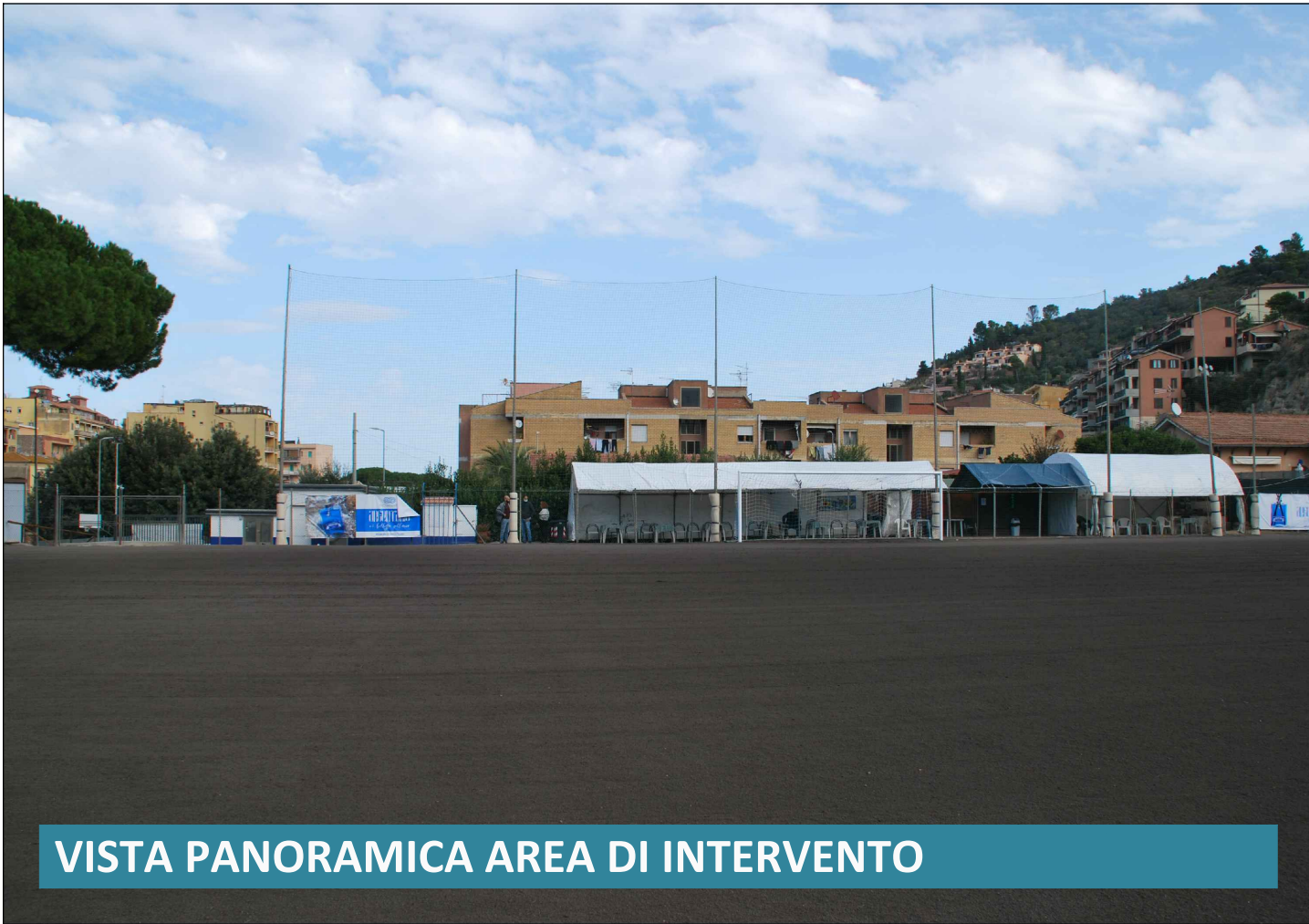
VISTA PANORAMICA AREA DI INTERVENTO